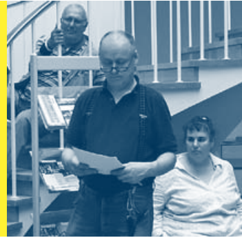
Eröffnung der Jahresausstellung des Atelier+ im Landeshaus